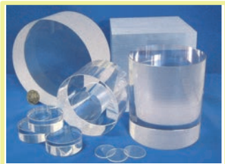
▲サファイア加工製品