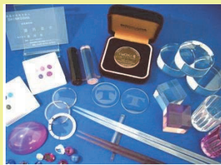
▲サファイアギフト