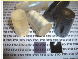
▲SrTiO 3 基板